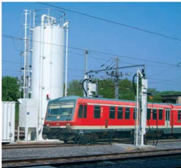
Besandungsanlage mit Kompressorstation im Container, Bremsandvorratssilo mit Filteranlage und zwei Besandungsstationen Typ kleinSAND.max stehend

Estación de Llenado de arena BSS2 de pie