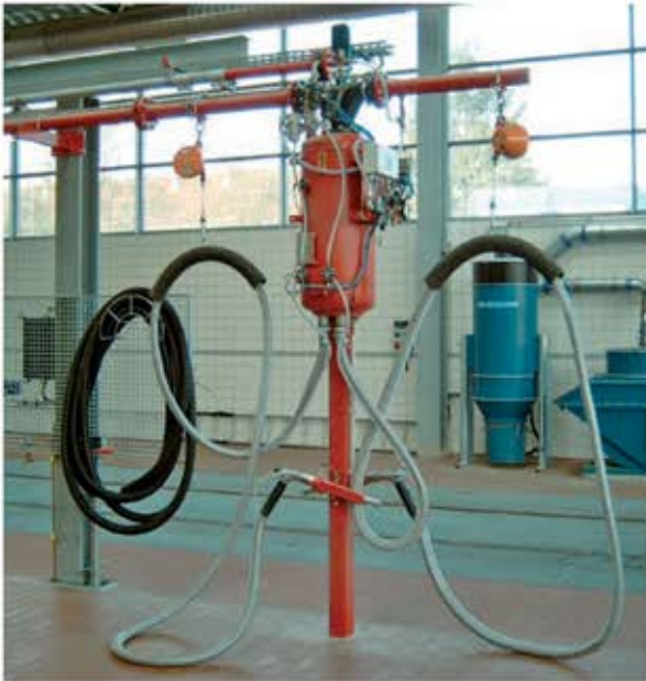
Besandungsstation Typ BSS2 stehend