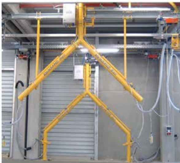
Besandungsstation Typ kleinSAND.max in Y-Ausführung hängend und stehend

Sistema de Llenado de arena con compresor (en contenedor), silo de almacenamiento de arena con filtro y dos estaciones de Llenado de arena tipo kleinSAND.max standing